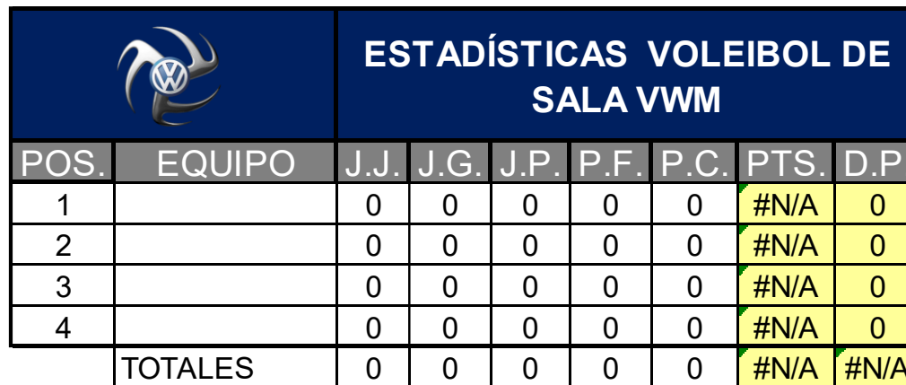
Tabla de posiciones y puntajes: